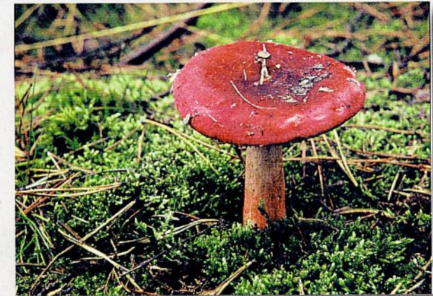
Täubling, der in Wurzelsymbiose mit Kiefern lebt

Frischpilzausstellung und Pilzberatung Sonntag, 16.09.