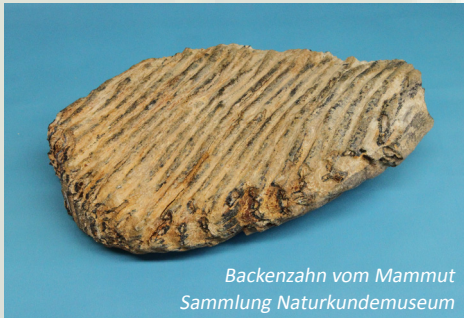
Backenzahn vom Mammut Sammlung Naturkundemuseum