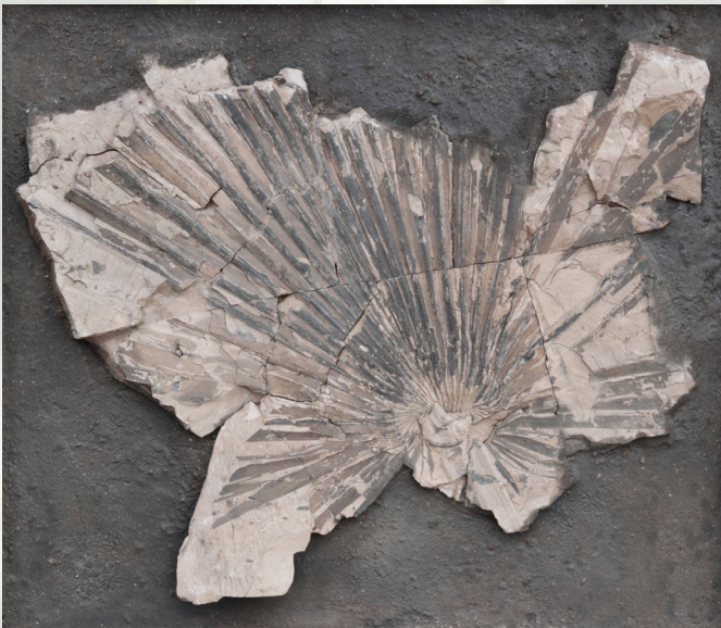
Palmwedel /Sammlung Naturkundemuseum/Tertiär

Das Archiv des international bekannten Geologen umfasst eine unwiederbringlich Sammlung an Fotos (davon 15.000 Dias zu geologischen Aufschlüssen und Phänomenen der Großtagebaue), Zeichnungen, geologischen Schnitten, Geodokumentationen in Grafiken und Literatur (ca. 1000 Bücher und über 15.000 geologische Sonderdrucke mit Schwerpunkt Mitteldeutschland).