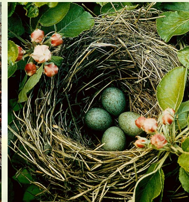
Blaumeisen, Kleiber, Amselgelege, Gelbspötter