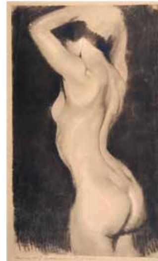
Max Klinger (1914)

Leipziger Buch- & Kunstantiquariat ulbricht-kunstauctionen.de